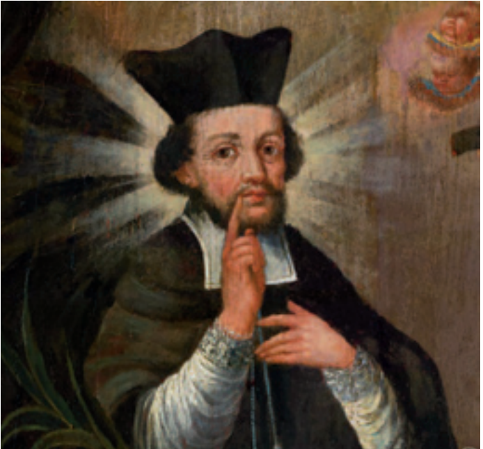
»Heiliger Johannes Nepomuk« 18. Jh., Museum Fürstenfeldbruck